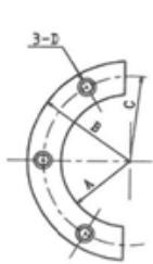
Type A (3 hole)