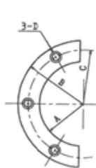
Type A (3 hole)